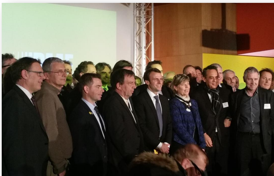
Lancement de la première promotion en présence d'Emmanuel Macron le 5 mars 2015

ARTESA sélectionnée en 2014, bpifrance Excellence , vient d'intégrer, avec 67 autres entreprises, la première promotion du programme Accélérateur PME souhaité par le Ministre de l'Economie.